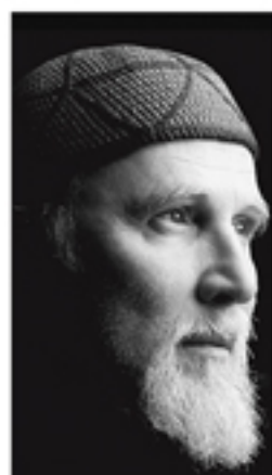
MONI OVADIA voce recitante

ORATORIO PER VOCE RECITANTE E QUINTETTO D'ARCHI