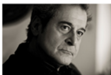
ENNIO FANTASTICHINI voce recitante